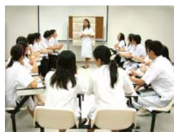
กิจกรรมโครงการปรับกระบวน ทัศน์นักศึกษาแพทย์ฯ คณะแพทยศาสตร์ ม.รังสิต

กิจกรรมโครงการที่ ได้รับทุนสนับสนุนจาก กสพท/สสส.