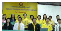
กิจกรรมโครงการจักสุข ใส สัมผัสโรงเรียน คณะแพทยศาสตร์ ม.เชียงใหม่